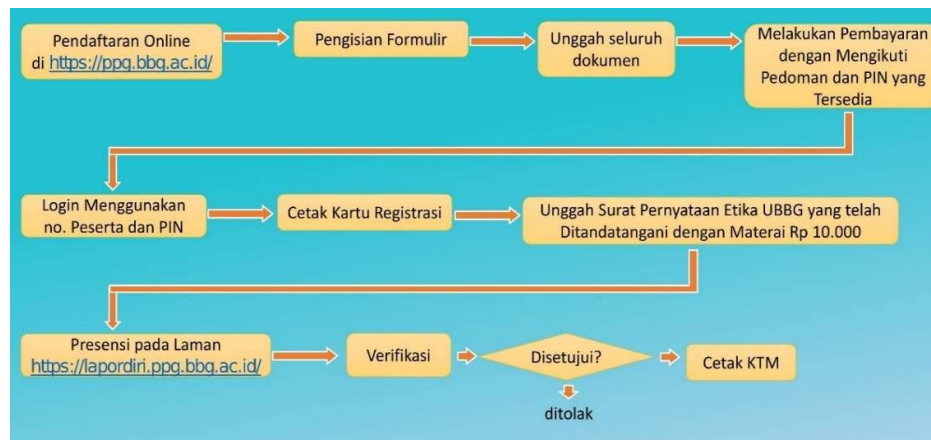
Gambar 3 Sistem Rekrutmen Calon Mahasiswa Prajabatan

Sistem rekrutmen calon mahasiswa PPG prajabatan di UBBG dimulai dari lapor diri mahasiswa PPG. Calon mahasiswa PPG langsung daftar akun dan login pada https://ppg.bbg.ac.id/ dengan no. peserta PPG. Calon mahasiswa mengisi formulir yang disediakan dan mengupload dokumen yang diminta. Calon mahasiswa diminta membaca pedoman penyelenggaraan PPG di UBBG. Selanjutnya, calon mahasiswa melakukan pembayaran ke bank dengan menggunakan pin yang tersedia di aplikasi pendaftaran calon mahasiswa UBBG. Setelah melakukan pembayaran, calon mahasiswa login kembali dengan menggunakan no. peserta PPG dan pin. Calon mahasiswa diminta mengisi formulir dan dokumen tambahan yang diupload. Setelah itu, calon mahasiswa diminta membuat surat pernyataan etika UBBG dengan format tersedia dan memberi tanda tangan yang bermaterai Rp10.000 yang diupload kembali pada https://ppg.bbg.ac.id/ . Apabila sudah diverifikasi dan disetujui, calon mahasiswa secara otomatis akan berubah status calon mahasiswa PPG menjadi mahasiswa PPG UBBG dengan permintaan mencetak kartu mahasiswa PPG UBBG.