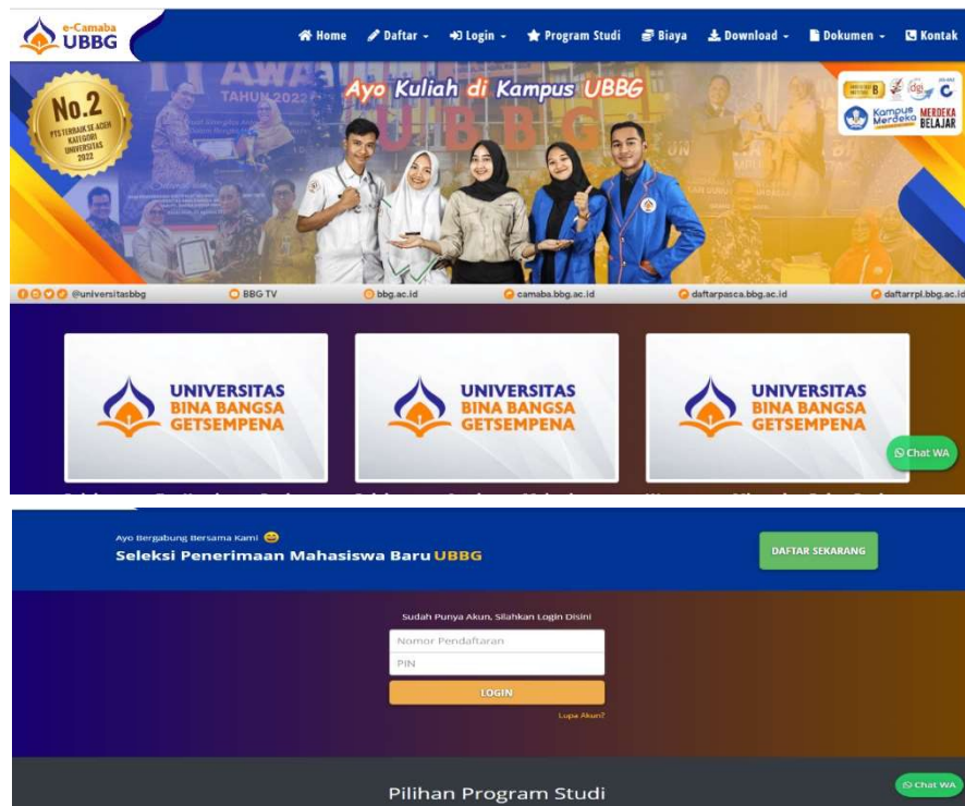
Gambar 4. Laman Penerimaan Mahasiswa Baru UBBG

Sistem pendaftaran online melalui website camaba.bbq.ac.id ini dimulai pada tahun 2015, mengingat teknologi informatika yang semakin canggih dan dapat diakses secara luas oleh calon mahasiswa. Melalui sistem ini, calon mahasiswa baru tidak perlu datang ke ke sekretariat Sipienu UBBG untuk mendaftarkan diri sebagai calon mahasiswa, akan tetapi dapat diakses langsung melalui website.