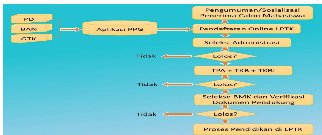
Gambar 2. Sistem Rekrutmen Calon Mahasiswa Dalam Jabatan

Sistem rekrutmen calon mahasiswa PPG dalam jabatan diawali dengan penyelenggaraan sosialisasi panggilan peserta dari panitia pusat. Sosialisasi tersebut dilakukan pada calon mahasiswa yang terdata pada PD Dikti, BAN PT, dan GTK. Setelah itu, calon mahasiswa melakukan proses pendaftaran melalui aplikasi yang disediakan dengan mengisi formulir secara online. Selanjutnya, panitia pusat melakukan seleksi administrasi calon mahasiswa dan mengumumkan hasil seleksi administrasi. Tahap selanjutnya, calon mahasiswa yang dinyatakan lulus administrasi mengikuti seleksi TPA, TKB, dan TKBI. Dengan tiga seleksi yang diikuti, panitia memberikan pengumuman dari hasil seleksi yang telah diikuti calon mahasiswa. Terakhir, calon mahasiswa masih melewati seleksi BMK dan verifikasi dokumen pendukung untuk dinyatakan sebagai mahasiswa yang akan mengikuti proses pendidikan di UBBG. Untuk lebih jelas, dapat dilihat pada gambar berikut.